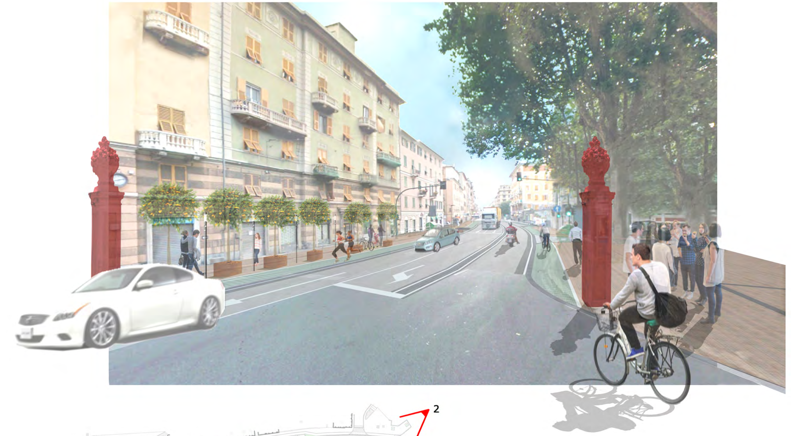
2- Piazza Massena - Via Cornigliano (verso ponente)